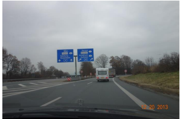
Kufstein nærmer sig