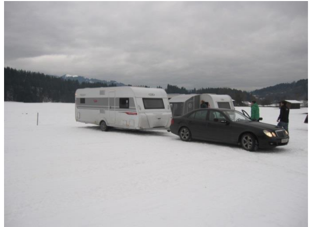
Vel ankommet til Panorama Camping I westendorf efter ca 12 timers køretid og ca 1100 km uden kø og på fine veje.