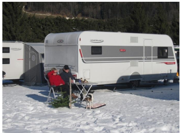
Og så er der dømt afslapning næste dag i sneen i dejligt solskindvejr :o)