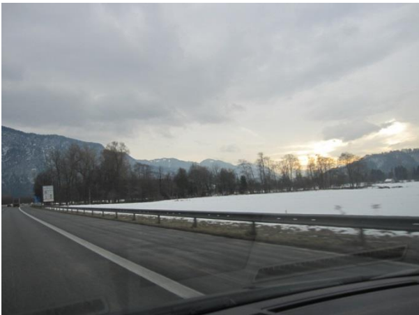
De Østrigske bjerge i sigte med en smule solskin.

Så er vi i Østrig og kørt af motorvejen og der ligger endelig sne. Det er altid spændende hvor meget der ligger og i år har det været en varm december hernede.