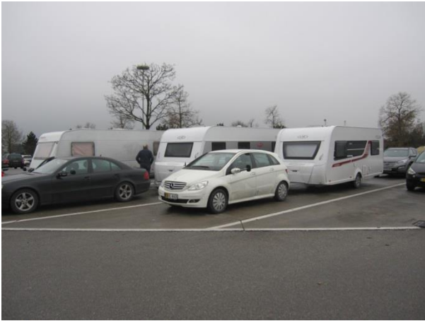
Et Lille pitstop i Tyskland i kedeligt gråvejr.