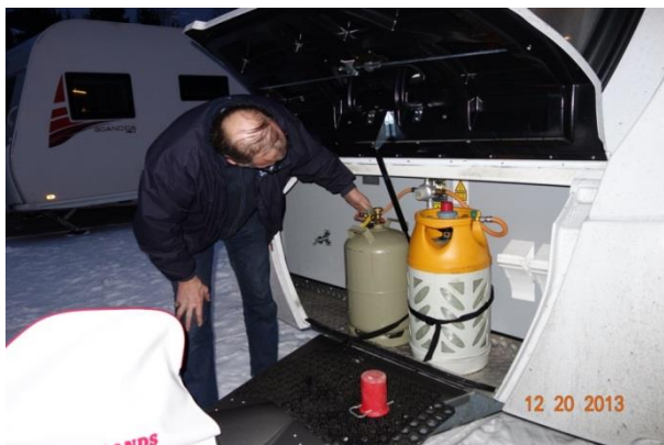
På med en Østrigsk gasflaske, så vi kun behøver at have gas med til ned og hjem.