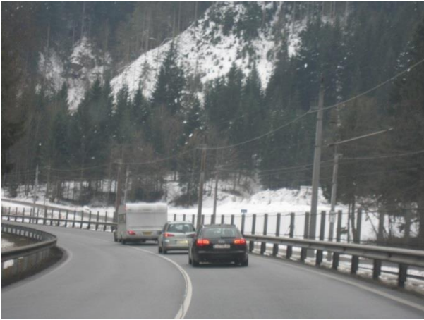
Den eneste stigning i Østrig klares uden problemer.